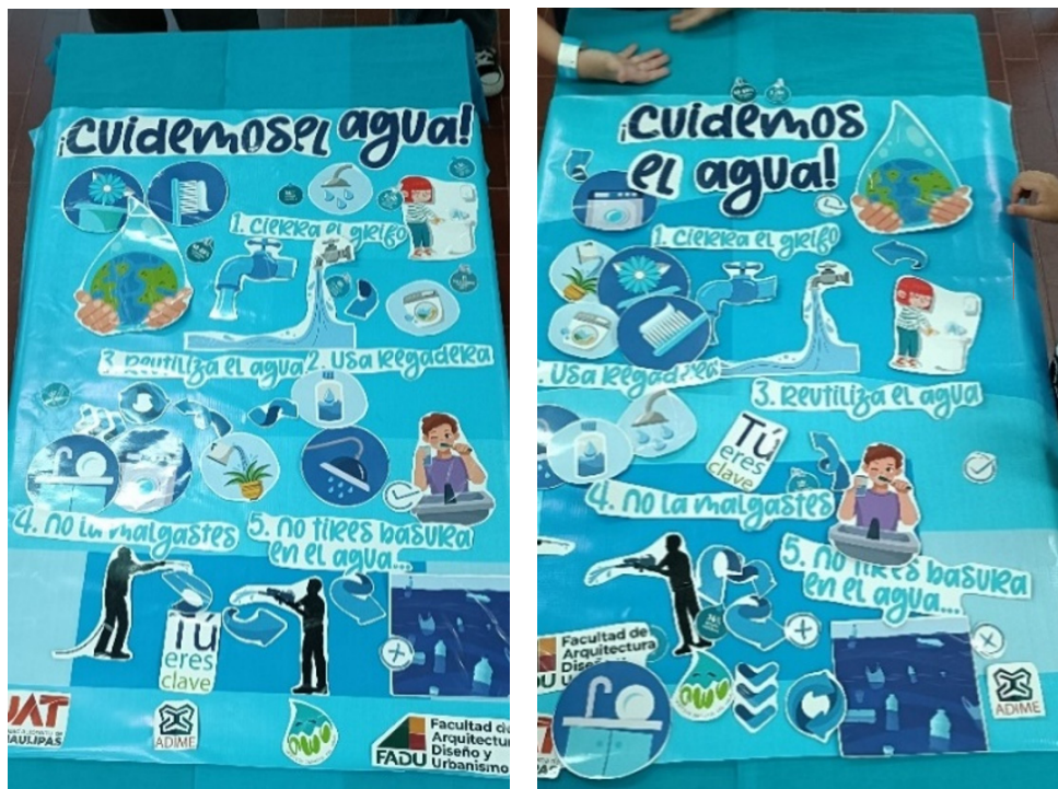
Ejemplos de Infografías Realizadas por los Niños G2EA y G2EB

Nota. El material de esta dinámica es propiedad del autor. Las imágenes fueron tomadas de bancos de imágenes libres de uso.